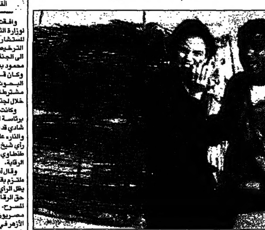
أحمد زكي وشرين رضا في مشهد من الفيلم